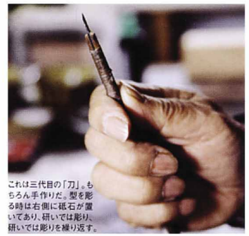
これは三代目の「刀」。もちろん手作りの。型を彫る時は右側に砥石が置かれており、彫り進めると砥石が磨いては彫りを繰り返す。