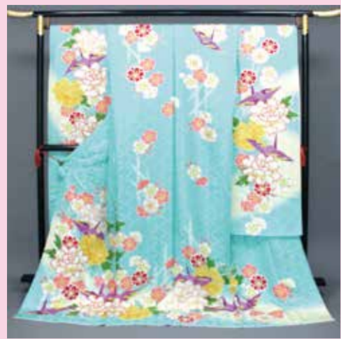
◆フルセット振袖 380,000円(税別)