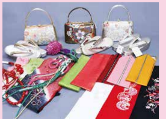
振袖用小物充実取り揃え