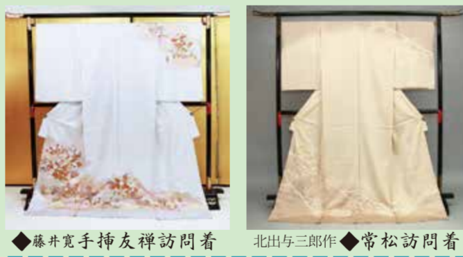
◆藤井寛手挿友禅訪問着 北出与三郎作 ◆常松訪問着