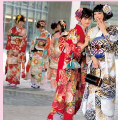
◆フルセット振袖 380,000円(税別)より

振袖クリエイティブユニット「ハタチスタイル」の想いと感性がぎゅっと詰まった、「ココ」にしかない新作振袖コレクション。ドキッと大胆だけど可愛い、ハタチスタイル振袖をお披露目!