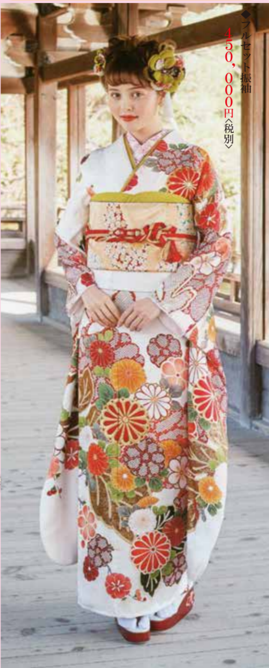
◆フルセット振袖 380,000円(税別)

着るのに必要な物全て揃った 30点安心フルセット こうづきオリジナル特別価格 380,000円 (税別) ＜ガード加工＞手縫いお仕立て付き