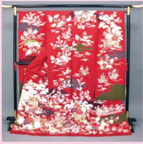
◆フルセット振袖 950,000円(税別)

フルセット価格は、振袖を着るときに必要な袋帯、長襦袢、その他の小物類を、当店で着物に合わせてコーディネートしたときの合計額で、ご参考までに示しています。